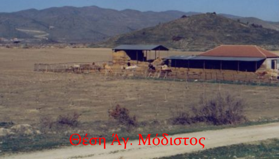
Θέση Αγ. Μόδιστος