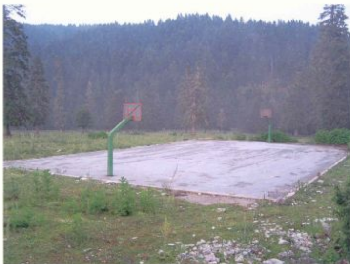
α/α 16. Το υφιστάμενο σήμερα γήπεδο μπάσκετ. Στο βάθος άποψη της ευρύτερης περιοχής.