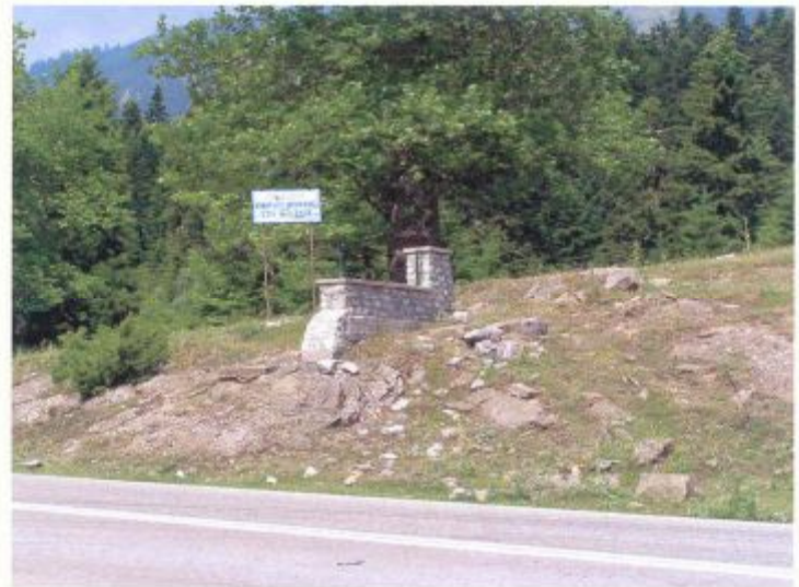
α/α 1δ. Θέση παλαιάς πινακίδας ενημέρωσης σχετικά με την λειτουργία του χώρου του γηπέδου ως χώρου δασικής αναψυχής (από σημείο λήψης απέναντι της κεντρικής εισόδου του γηπέδου).