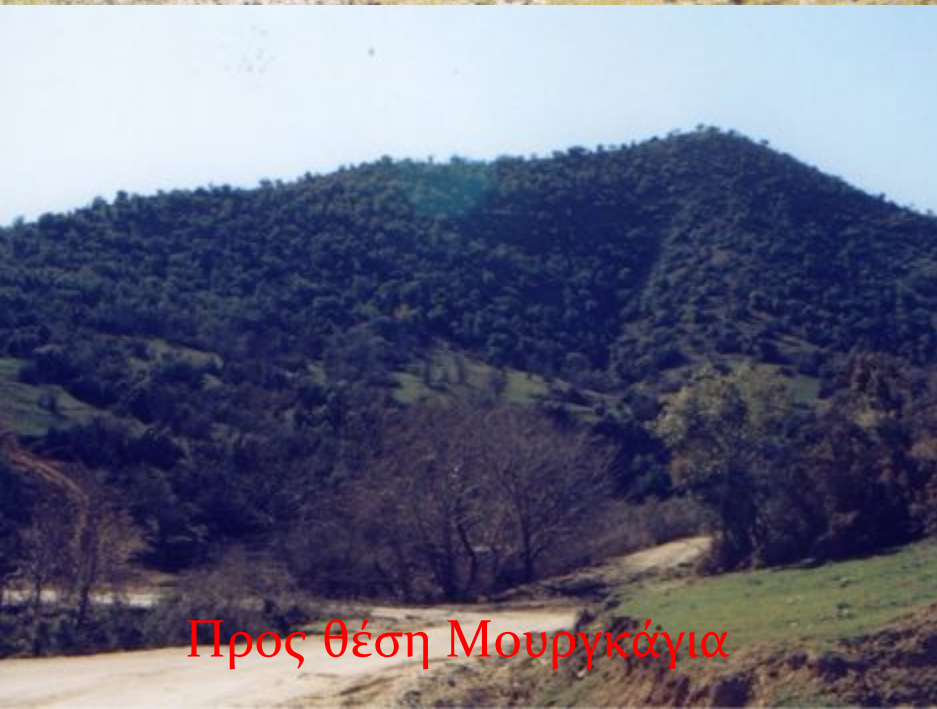
Προς θέση Μουγκάγια