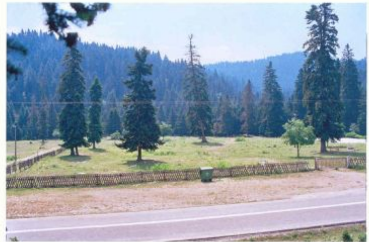
α/α 1γ. Άποψη του περιφραγμένου γηπέδου (από σημείο λήψης βορείως αυτού και της εθνικής οδού) με την κεντρική του είσοδο. Στο βάθος ευρύτερη άποψη της περιοχής.