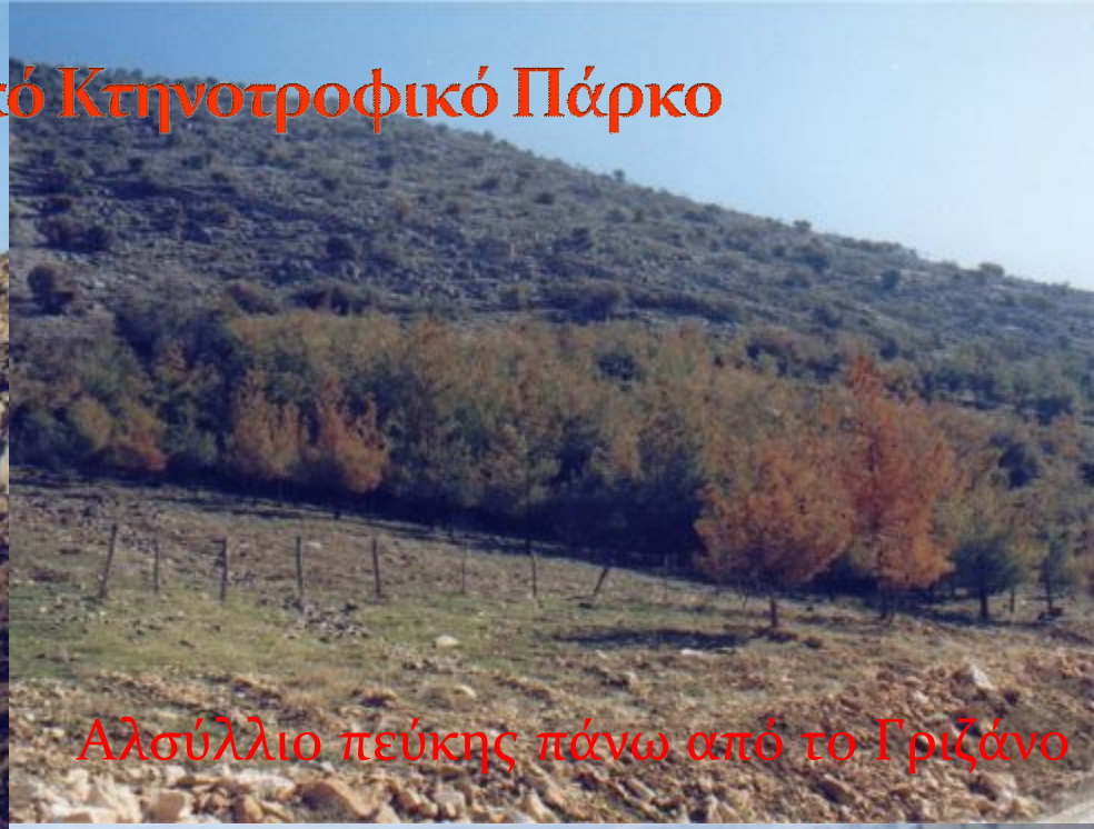
Ασύλλιο πεύκης πάνω από το Γριζόνο