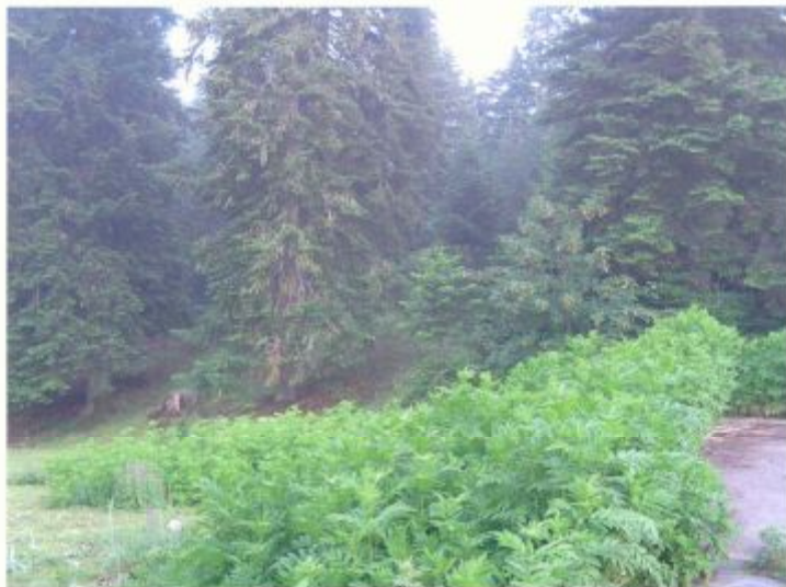
α/α 15β. Άποψη της συστάδας στο λοφίσκο του γηπέδου, ΝΑ του υφιστάμενου γηπέδου μπάσκετ.