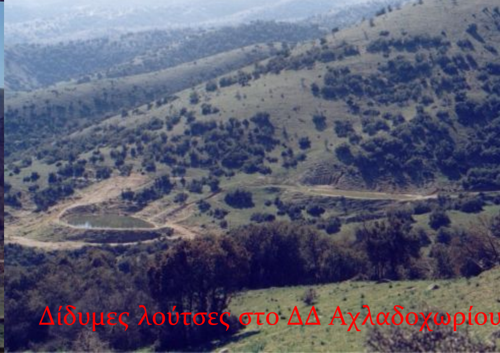
Δίδυμες λούτσες στο ΔΔ Αχλαδοχωρίου