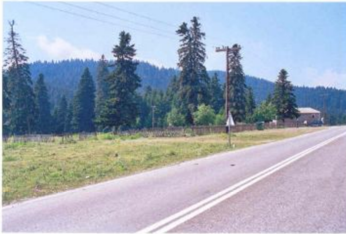
α/α 1α. Η θέση του γηπέδου παρακλήριως του εξωκκλησιού της Αγίας Κυριακής και Β-ΒΑ της ξύλινης περιφραξής του (από σημείο λήψης επί της ασφάλτου)