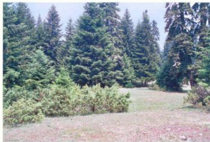
α/α 7. Εσωτερικό της Δ πλευράς του γηπέδου. Δάσος σε ομάδες και λόγχες, με ενδιάμεσα φυσικά απομονωμένα κενά για τοποθέτηση σκηνών.