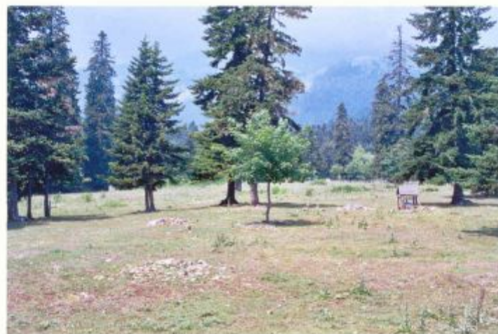
α/α 9. Άποψη, στο κέντρο, περίπου του γηπέδου. Στο βάθος άποψη της ευρύτερης περιοχής.