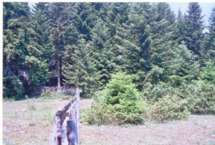
α/α 6. Η Δ πλευρά του γηπέδου με τις κατά τόπους πυκνότερες συστάδες ελάτης. Εξωτερικά η περίφραξη αυτής.