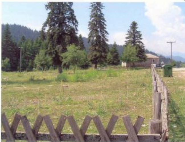
α/α 1ε. Η ΒΔ γωνία και πλευρά του γηπέδου, με την σημερινή περίφραξη, την διερχόμενη μέσω αυτού γραμμή δικτύου του ΟΤΕ προς Πετρούλι, το υφιστάμενο εντός αυτού σήμερα γήπεδο μπάσκετ και το εκτός του γηπέδου και της περιφραξης εξωκλήση της Αγίας Κυριακής. Στο βάθος άποψη της ευρύτερης περιοχής.