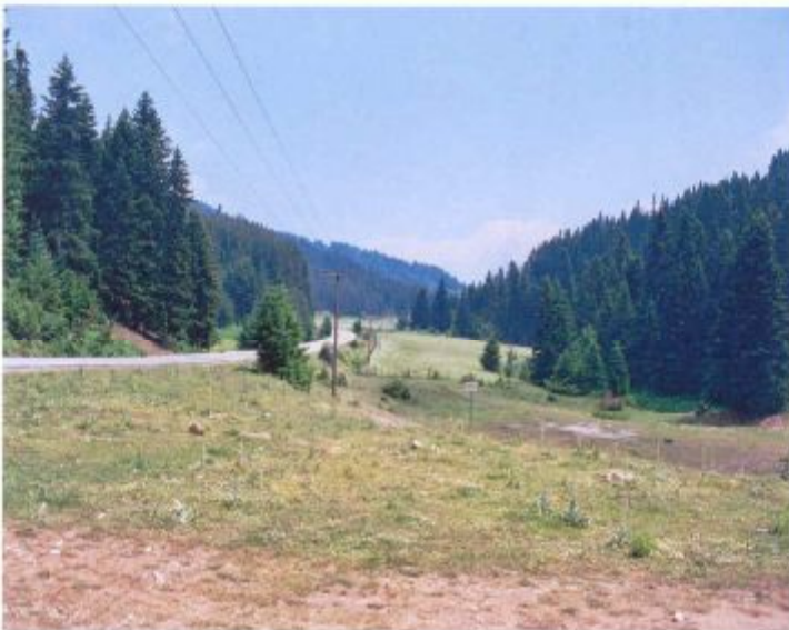
α/α 1β. Άποψη της ευρύτερης περιοχής ανατολικά του γηπέδου (προς τα «Λιβιάδια Πετρουλίου»).