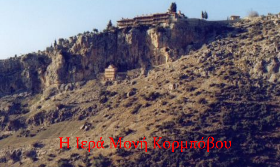
Η Ιερά Μονή Κορμπόβου