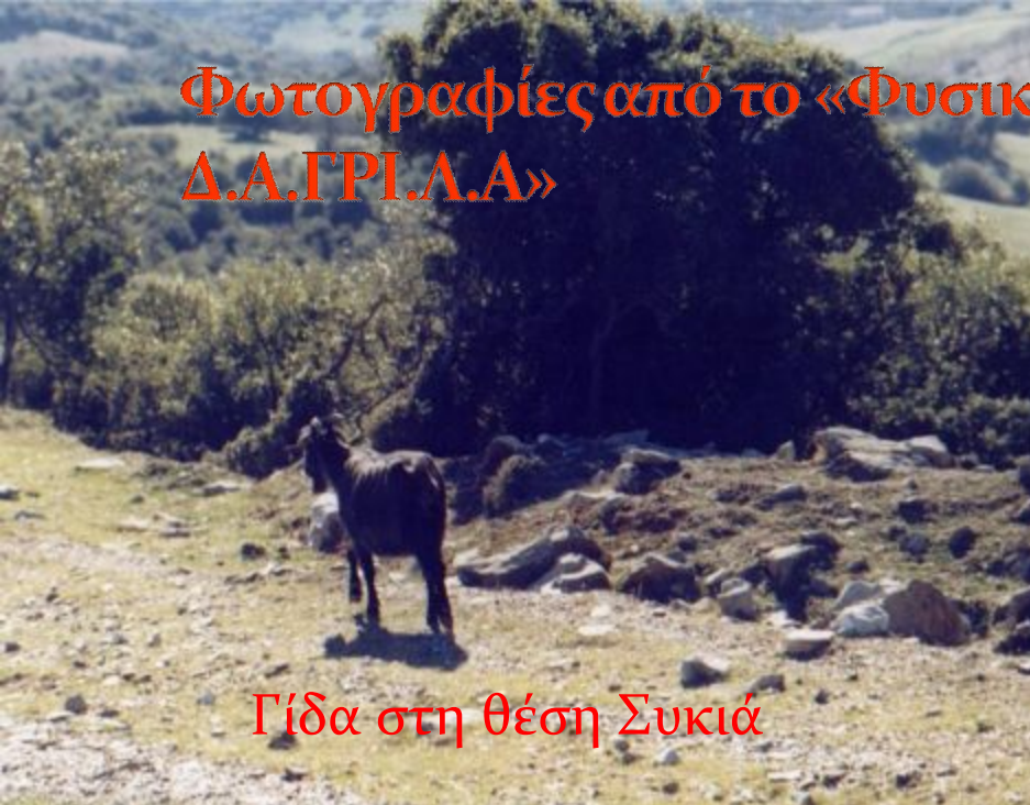
Γίδα στη θέση Συκιά