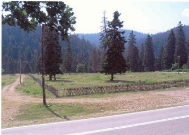
α/α 2. Η ΒΔ πλευρά, η ΒΑ γωνία και πλευρά του γηπέδου, με την σημερινή περίφραξη, την διερχόμενη μέσω αυτού γραμμή δικτύου της ΔΕΗ και του ΟΤΕ προς Πετρούλι, το υφιστάμενο σήμερα γήπεδο μπάσκετ (δεξιά) και την διερχόμενη εθνική οδό Τρικάλων - Ελάτης - Πετρουλίου - Νεραϊδοχωρίου - Άρτας βορείως αυτού. Στο βάθος άποψη της ευρύτερης περιοχής.