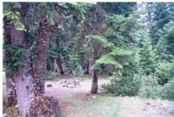
α/α 8. Εσωτερικό της Δ πλευράς. Διακρίνεται η φυσικά απομονωμένη θέση, όπου είχε τοποθετηθεί σκηνή.