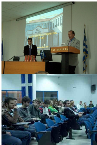
Εικόνες από την εκδήλωση

Στα μέσα του προηγούμενου μήνα, στις 15 Οκτωβρίου, πραγματοποιήθηκε η υποδοχή και το καλωσόρισμα των πρωτοετών φοιτητών του Τμήματος για το ακαδημαϊκό έτος 2008-09.