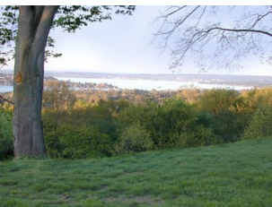
Σε αναμονή ...

Με τη συμπλήρωση βέβαια των 10 ετών, θα εορτασθεί η επέτειος όπως αρμόζει.