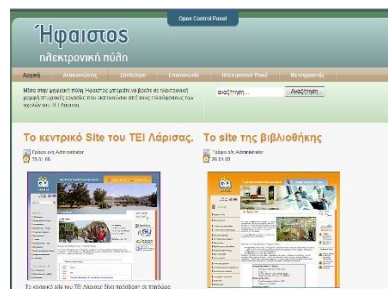
Η ψηφιακή πύλη Ήφαιστος του ΤΕΙ Λάρισας

δους για την βέλτιστη δημοσιοποίησή τους. Σε αυτή την κατεύθυνση επιθυμητό είναι να γίνεται και η καταχώρηση των πτυχιακών εργασιών για την περαιτέρω δημοσιοποίησή τους (ως γκρίζα βιβλιογραφία) στο portal Ήφαιστος του ΤΕΙ/Λ ( http://ifestos.teilar.gr/ ).